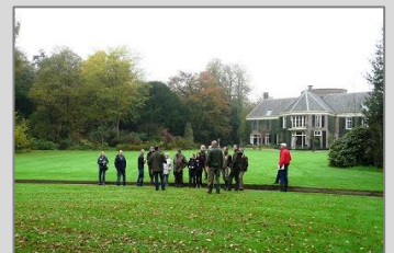
De Wildenborch, 30 oktober 2014 Zie de impressie via deze link .