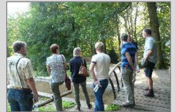
De plek waar een doorkijk tussen hoge rododendrons was bedacht.