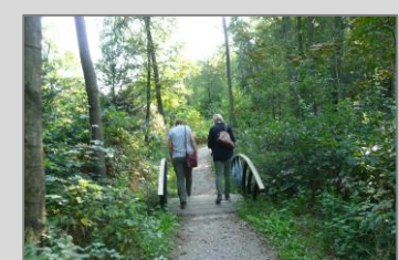
Door de ontwikkelingen werd Beekhuizen weer herkenbaar als landgoed, voorheen was het een bos.