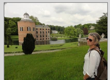
Rosendaal, 21 mei 2015 Zie de impressie via deze link .