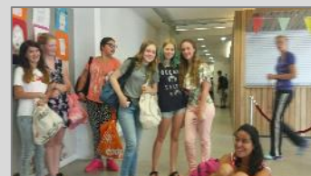
Toekomstige tuinbazen en beheerders van Monumentaal Groen!