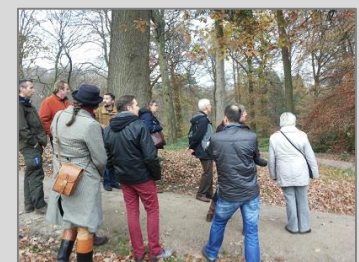
Rhedeoord, 27 november 2014 Zie de impressie via deze link .