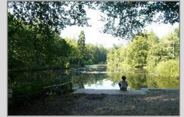
De vijver van Beekhuizen.

(Hoe) houd je een klankbordgroep levend? Is een tweede vraag die aan de orde kwam in deze groep. Een klankbordgroep kan ook in de beheerfase soms nog heel goed meedenken. Natuurmonumenten werkt op sommige plekken met een (Whats)app groep. Buurtbewoners stellen daarin vragen, signaleren problemen en