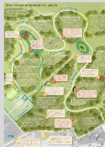
De routekaart voor Monumentaal Groen, klik hier of dubbelklik op de afbeelding om de kaart te openen.

De eerste stop op Beekhuizen is bovenop de Keienberg, een rustplek die bol staat van de symboliek en betekenis. De akoestiek op deze plek is heel bijzonder! Uiteindelijk is het de bedoeling dat er vanaf de Keienberg opnieuw uitzicht komt over het IJsseldal.