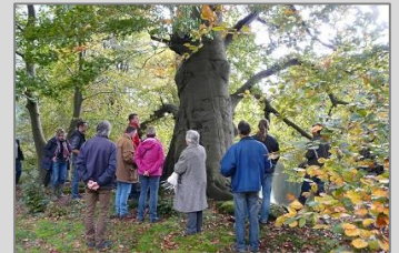
Voorstonden, 16 oktober 2014 Zie de impressie via deze link .

De praktijkmiddag op Beekhuizen is de laatste in een reeks van acht praktijkdagen: