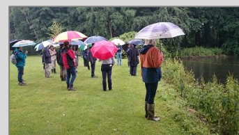
't Zelle, 13 juni 2016 Zie de impressie via deze link .