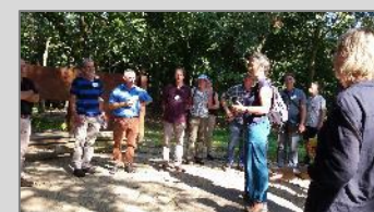
De bijzondere akoestiek bovenop de Keienberg wordt uitgeprobeerd!