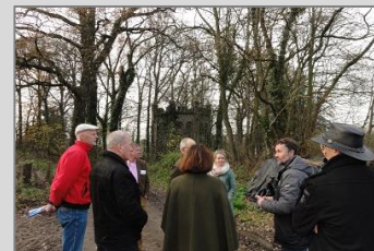
Huis Sevenaer, 8 december 2015 Zie de impressie via deze link .

Dit was de laatste praktijkdag in een reeks van acht. In de grijze balk vindt u een overzicht van de praktijkdagen inclusief een link naar de impressie. We zijn benieuwd naar uw waardering van de praktijkdagen en wat deze u hebben gebracht aan kennis, kunde en een netwerk voor beter behoud van groen erfgoed. Vult u daarom de evaluatie in via deze link . Mede op basis van de evaluatie bekijkt de provincie op welke wijze ze vervolg geeft aan de activiteiten voor Monumentaal Groen. En zoekt u elkaar beslist ook in de toekomst nog regelmatig op om samen te kijken en discussiëren over het groene erfgoed dat Gelderland rijk is!