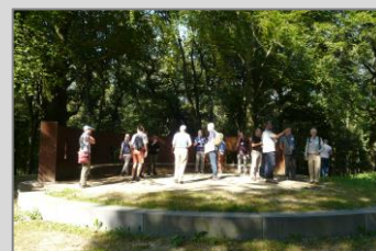
Beekhuizen, 8 september 2016