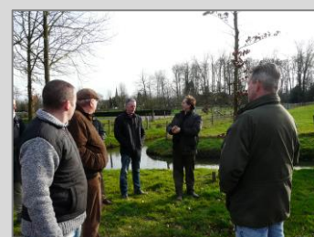
De Cannenburch, 26 januari 2016 Zie de impressie via deze link .