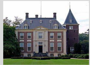
Landgoed Huis Verwolde

Als deelnemers nog aanvullende suggesties hebben kunt u die onderwerpen sturen naar secretariaat@wing.nl onder vermelding 'suggestie praktijkreeks Monumentaal Groen'.