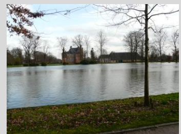
De bijzondere historische omgeving is erg belangrijk voor het kasteel.