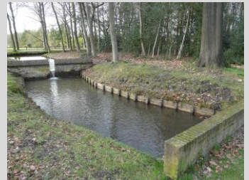
Waterinvoer vanuit de Veluwe