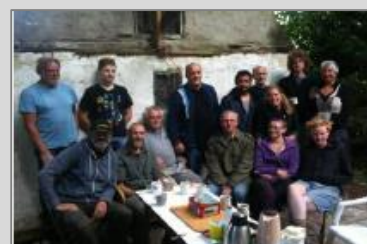
Vrijwilligers op Landgoed Huis Sevenaer