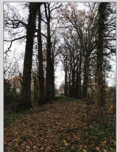
Cultuur versus natuur