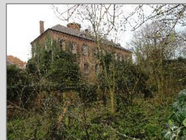
Landgoed Huis Sevenaer